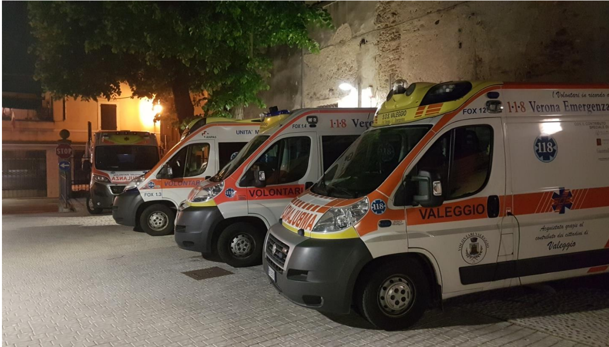
I veicoli di S.O.S. VALEGGIO

Le ambulanze dell'ente sono conformi alla norma EN 1789/2007 veicoli tipo B (autoambulanza per il pronto soccorso, per il servizio di emergenza e per il trasporto, il trattamento di base e il monitoraggio dei pazienti gravi). Allestimento, impiantistica e dotazione di bordo rispondono alle normative vigenti.